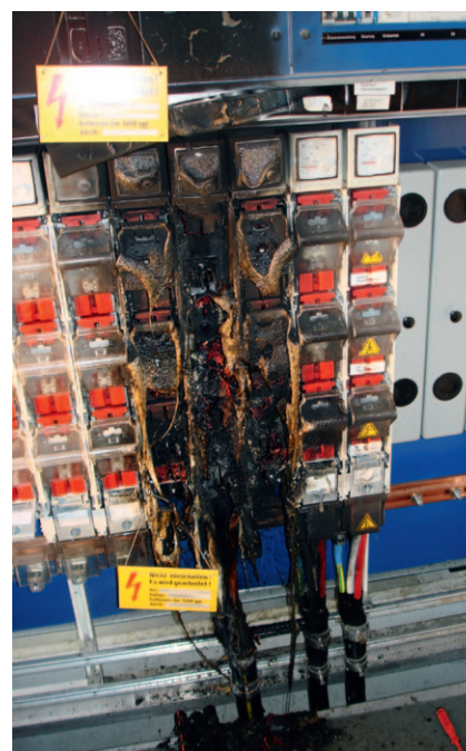
Schaden durch Kurzschluss beim Arbeiten; Person schwer verletzt.

Bei Arbeiten in einer Anlage ist anhand der ESTI-Weisung Nr. 407 zu definieren, wer wie in der Anlage arbeiten darf. Es ist eine Person zu bestimmen, welche für die Sicherheit verantwortlich ist und die Einhaltung der 5+5 lebenswichtigen Regeln im Umgang mit Elektrizität überwacht. Es ist dafür zu sorgen, dass für Arbeiten in der Annäherung oder Gefahrenzone entsprechende persönliche Schutzausrüstungen und die richtigen Apparate und Geräte zur Verfügung stehen. Bei unübersichtlichen oder komplexen Arbeiten ist grundsätzlich ein schriftlicher Auftrag zu erstellen. Vor der Inbetriebnahme ist die Anlage zu überprüfen, ob diese betriebsbereit und den sicherheitstechnischen Anforderungen entspricht. Die Arbeitsweise ist im Sicherheitskonzept zu dokumentieren.